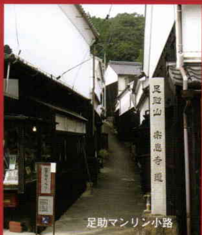
足助マンリン小路