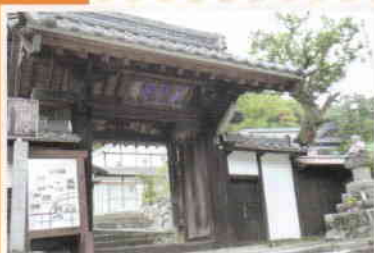
名所スタンプ地点