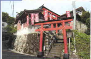
名所スタンプ地点