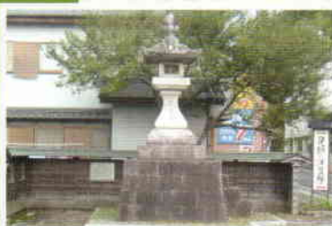
名所スタンプ地点