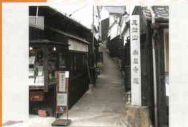
名所スタンプ地点