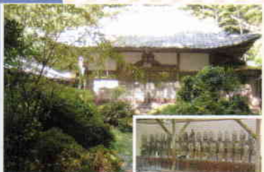
名所スタンプ地点