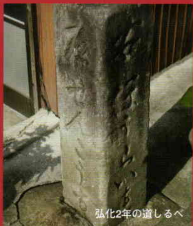
弘化2年の道しるべ