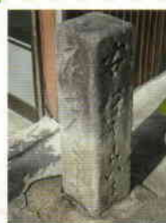
名所スタンプ地点